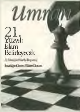
Kapak illüstrasyon: Sezzer Erdoğan